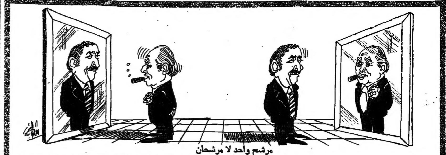
مرشح واحد لا مرشحان